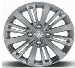
16" Titane Gris Hephais