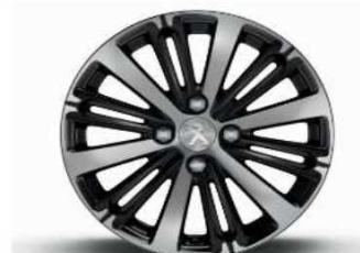
16" Titane Technical Grey