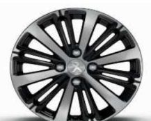
16" Titane Technical Grey