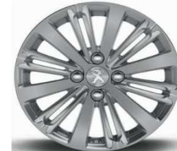
16" Titane Gris Hephais