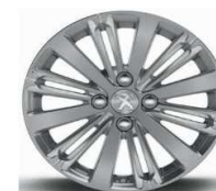
16" Titane Gris Hephaïs