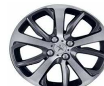
17" OXYGENE Technical Grey