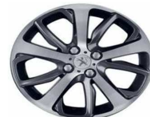
17" OXYGENE Technical Grey