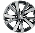
17" Diamanté Eridan Anthra grey