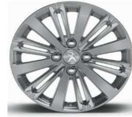
16" Titane Gris Hephais