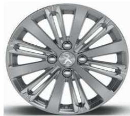
16" Titane Gris Hephais