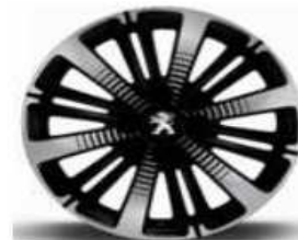
16" Titane Diamantage Noire Vernis