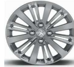
16" Titane Gris Hephais