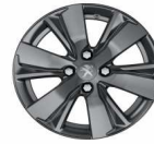
16" HYDRE DILLIUM Grey