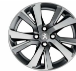
17" Diamanté Eridan Anthra grey