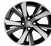
17" Eridan Noir Brillant