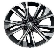
17" MERION Diamantee